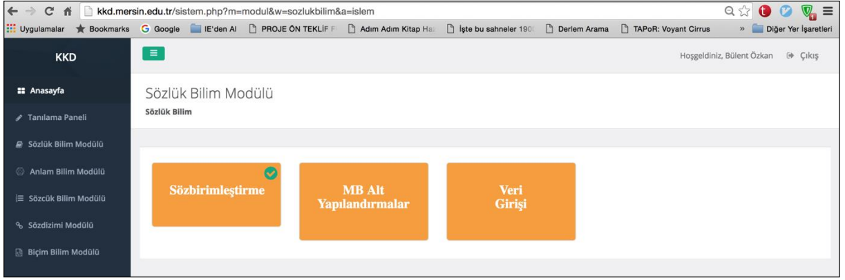
Şekil 1. Sözlük Bilim Modülü işlem aşamaları

Bu aşamada Tanılama Paneli aracılığıyla oluşturulan derlemden sözbirimleştirilmiş yapılar ve buna bağlı olarak derlemede yer alan tümceler ve bu tümcelere ait matadatalar veri işleme aşamalarına katılmaktadır (Şekil 12).